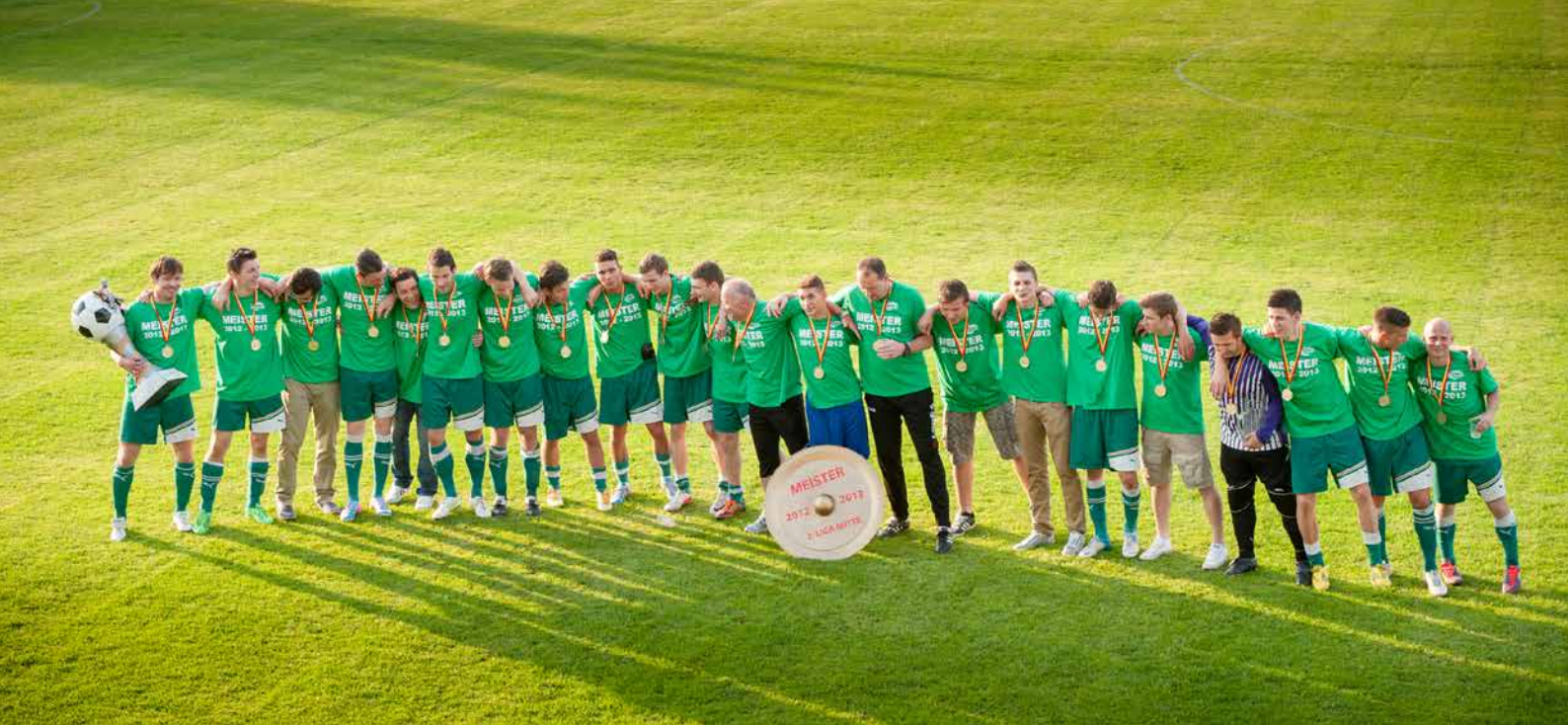
Der SV FORCHTENSTEIN kehrt nach drei Jahren wieder in die höchste burgenländische Spielklasse zurück! © Jansenberger Fotografie | www.digitalimage.at | Forchtenstein