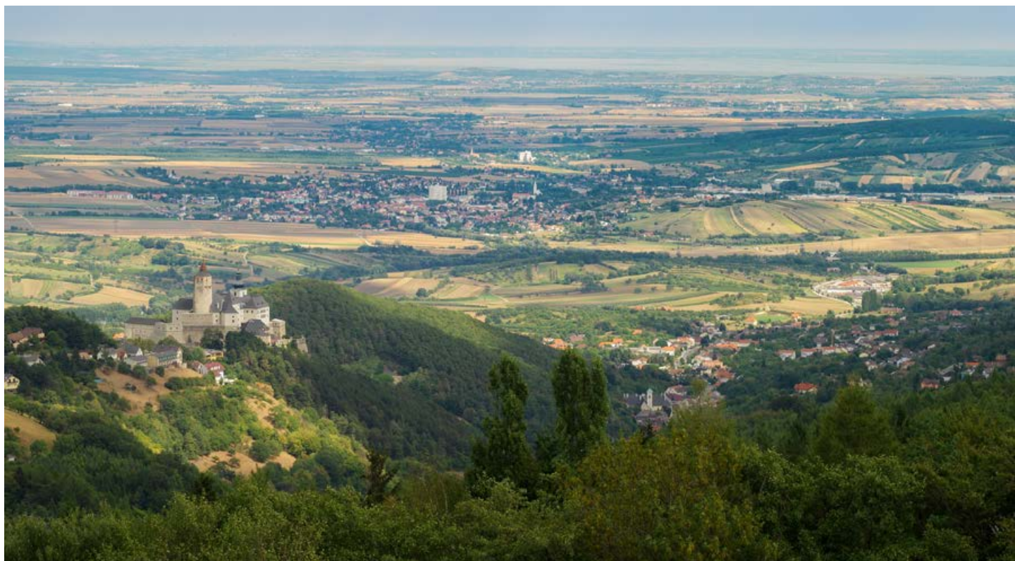
Blick von der Rosalienkapelle.