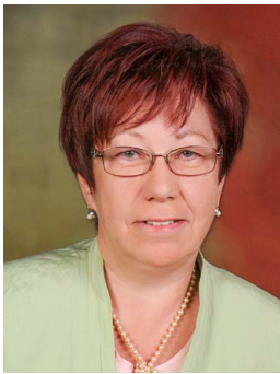
Friederike Reismüller Bürgermeisterin Forchtenstein